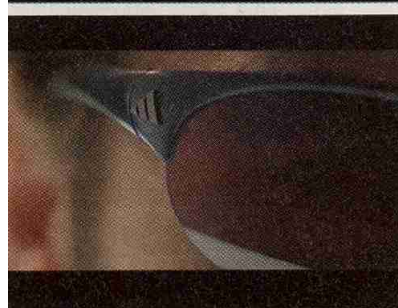
Mit dem Promotionspot The Eye für Adidas Eyewear wurde CASAMEDIA mit dem Saturn in Gold in der Kategorie TV- und Kinospots ausgezeichnet.