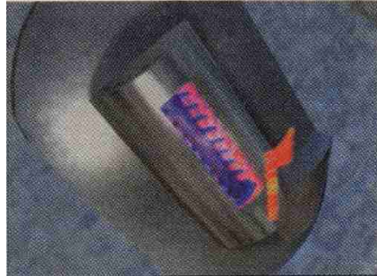
Mit der Animation The Process fuer Boehler Edelstahl, die ein neues Verfahren zur Herstellung von Stahl erklärt, holte die Monte Video den Saturn in Gold in der Kategorie Computer - Animation.