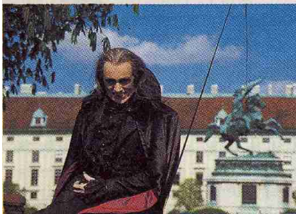
Mit dem Video Time4Vienna, das von Wien Tourismus in Auftrag gegeben wurde, um junge Leute unter 30 nach Wien zu bringen, holte die Epo-film Produktion den goldenen Saturn in der Kategorie Wirtschaftsvideos.