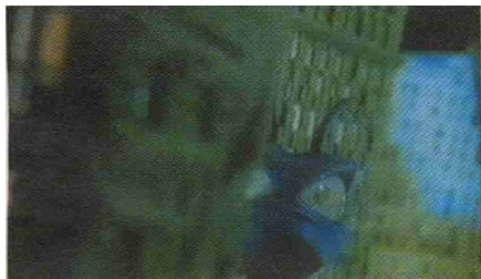
Der neue PEZ-Spot (Agentur: Reklamebüro) kommt in Australien, Frankreich und England zum Einsatz.